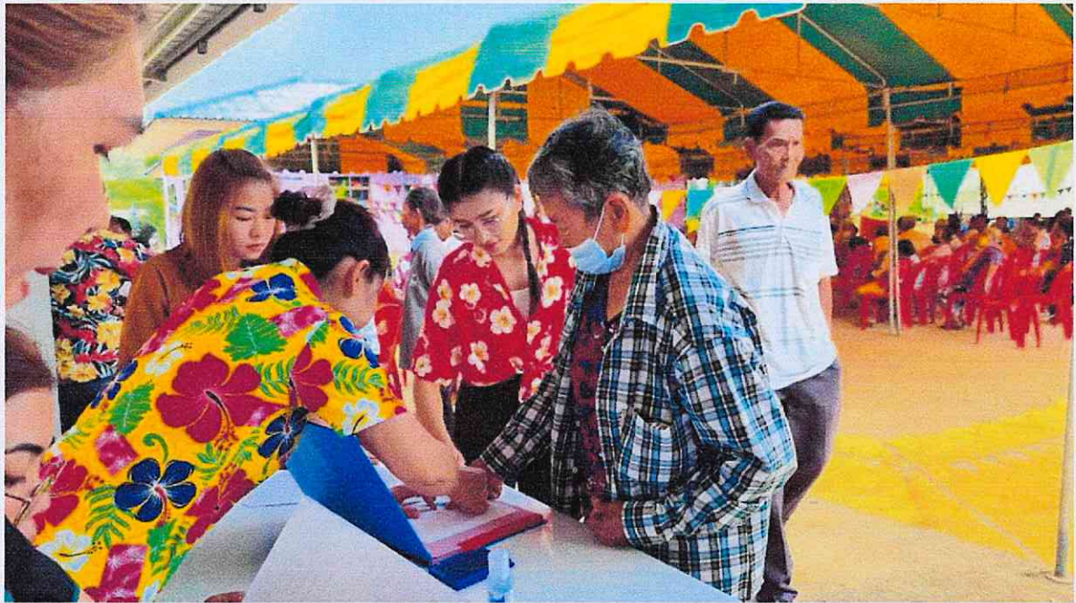
กิจกรรม แจกถุงยังชีพ จากสถานีกาชาดหัวหิน